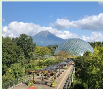
「とっとり花回廊」(イメージ)