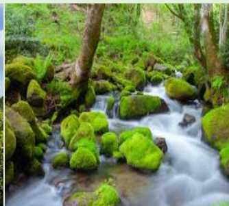
「木谷沢溪流」(イメージ)

ご案内 本パンフレット制作時点にて一部報道によりGoToトラベルキャンペーン再開情報がございます。しかしながら具体的な内容が未確定のため本パンフレットではGoToトラベルキャンペーン割引適用前旅行代金のみを表示しております。詳細が決定しましたらホームページ・電話等で割引額をご案内しますので、詳しい条件をご確認の上お申し込み下さい。